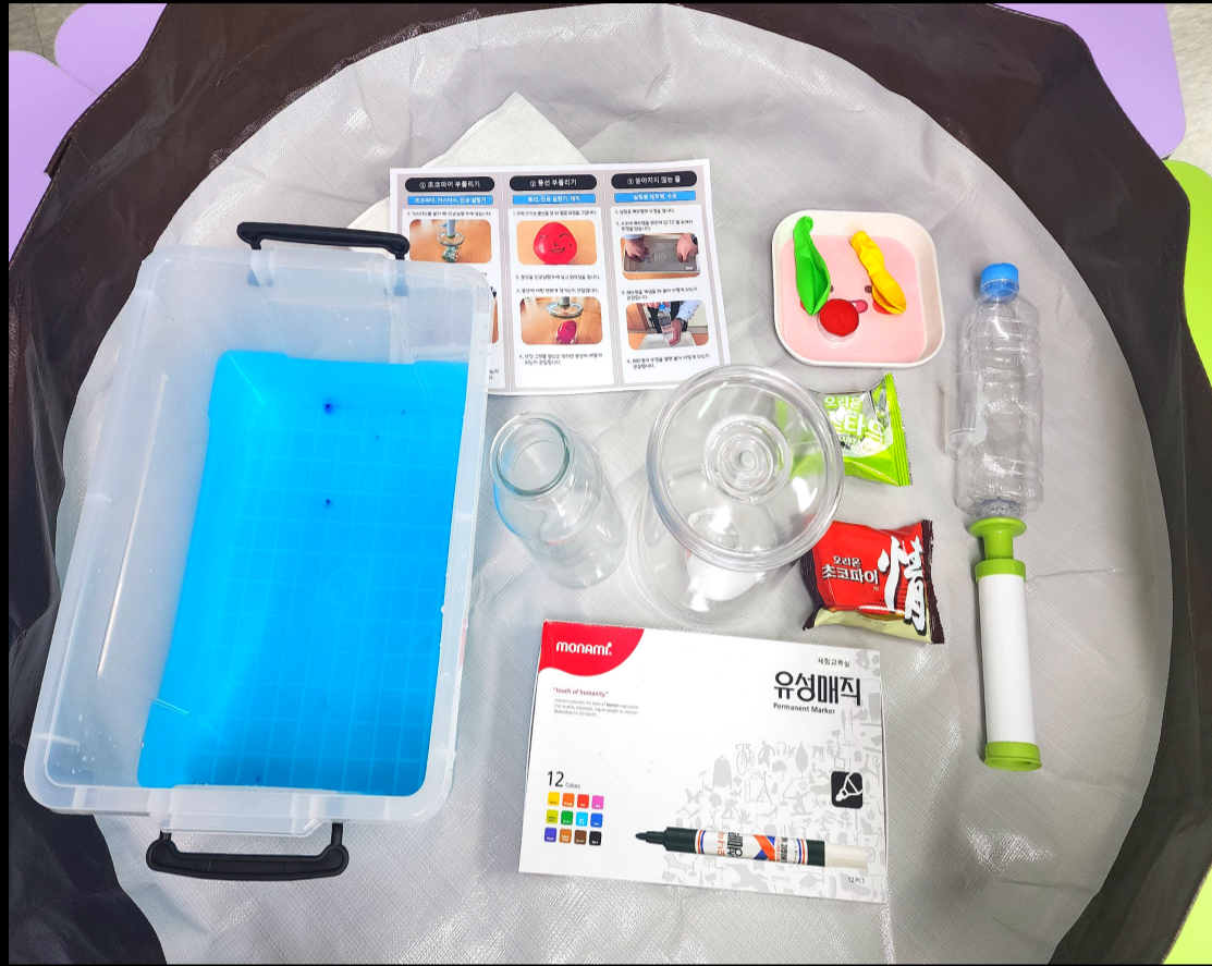
여러가지 실험 도구들! 과연 어떤 실험을 하게 될까요?