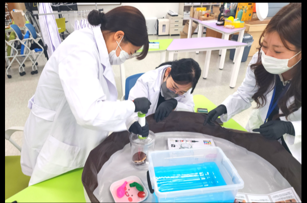
진공 실험기 속 초코파이의 운명은?! ㅋㅋ

5월부터 운영하는 신규 체험교육 프로그램 "엉뚱발랄 과학 실험실" 을 소개합니다 :)